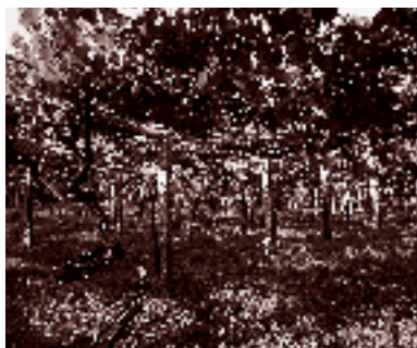
リアス・バイシャスのベルゴラ

スペインワインという一般的な赤ワインを連想される方が多いかと思いますが、スペインの白ワインも見逃せません。その白ワインの代表的品種といえば、アルバリニョです。翡翠色をしたぶどうからできるワインは、緑がかった黄色。香りが高く、酸味も豊かで、バランスのとれた口