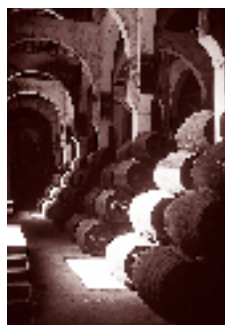
ソレラ・システム

アペリティブとしてスペインが世界に誇るシェリー。19世紀後半以降、世界の社交場で必需品となっているものです。そのシェリー造りの主体となるぶどう品種がパロミノです。